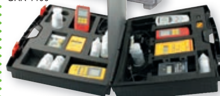
Farbe kann abweichen