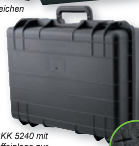
GKK 5240 mit Schaumstoffeinlage zur individuellen Gestaltung